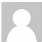
MAX Z. KOWALSKY

Jetzt hier klicken und schon bald mit 1000 Euro reich an der Börse werden.