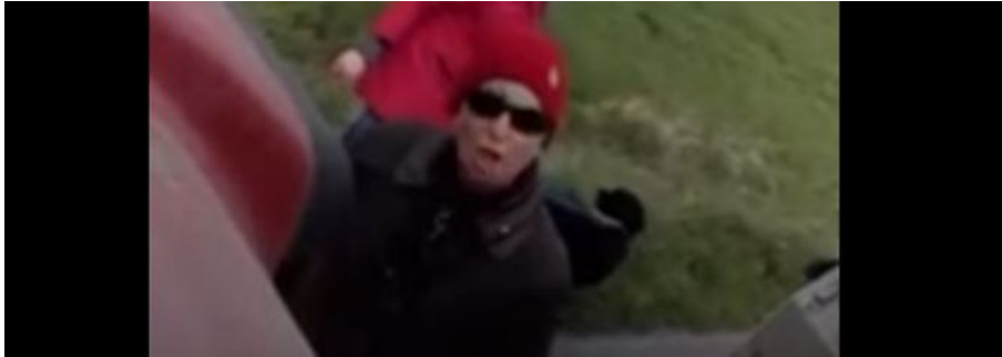
In dem Video beschimpft die Spaziergängerin - ihren Aussagen nach zu urteilen eine Veganerin - einen Bauern.